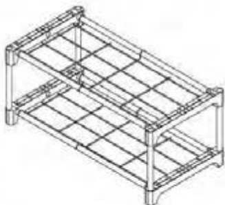
Общий вид изделия