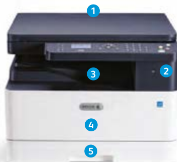
Многофункциональное устройство Xerox® B1022

9 МФУ Xerox® B1025 оснащено цветным сенсорным интерфейсом с диагональю 4,3 дюйма, дополнительно упрощающим работу.