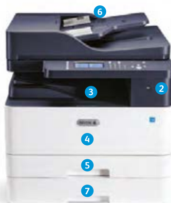
Многофункциональное устройство Xerox® B1025

Конфигурация DADF показана с опциональным дополнительным лотком.