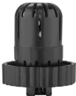
Рис. 7 Фильтр-картридж FC-1000

В комплект прибора входит фильтр с ионообменной смолой. При длительном использовании увлажнителя без замены фильтра на приборе и на предметах рядом с ним может появиться белый осадок.