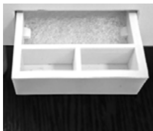
Ванночка для эфирных масел