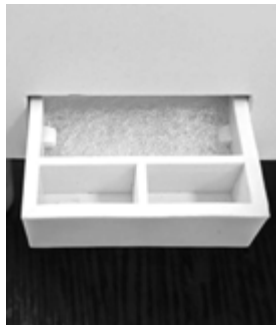
Ванночка для эфирных масел