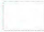
Компостная куча (сброс)